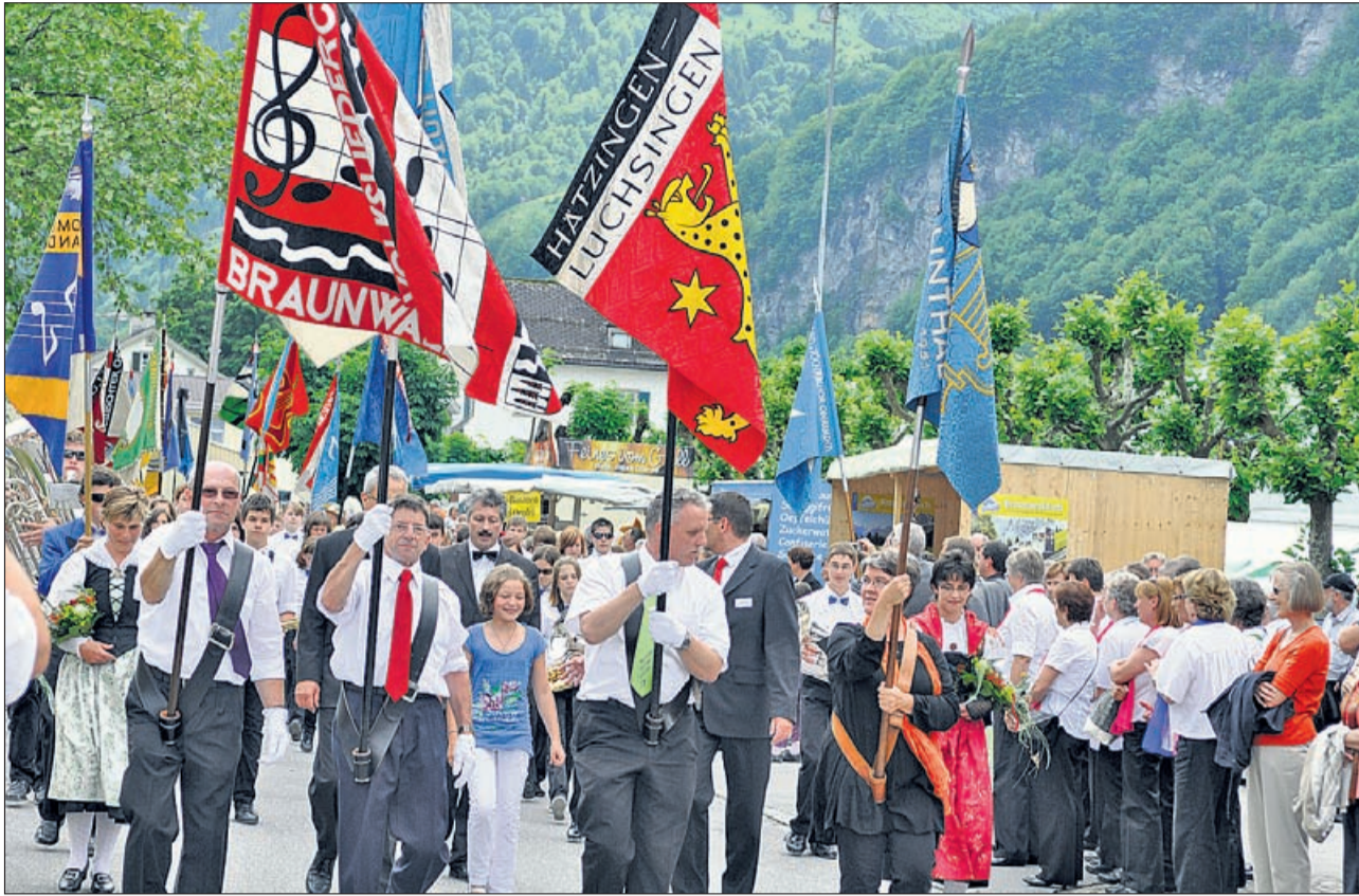
Ab zum Bahnhof: Die Sängerschar holen die Kantonalfahne ab.

Über 70 Chöre mit rund 2000 Sängerinnen und Sängern sowie zahlreiche Gäste und Schaulustige tummelten sich am letzten Wochenende am südlichsten Ende des Glarnerlandes. Denn Linthal war in diesem Jahr Austragungsort des Glarner Kantonalen Gesangsfestes.