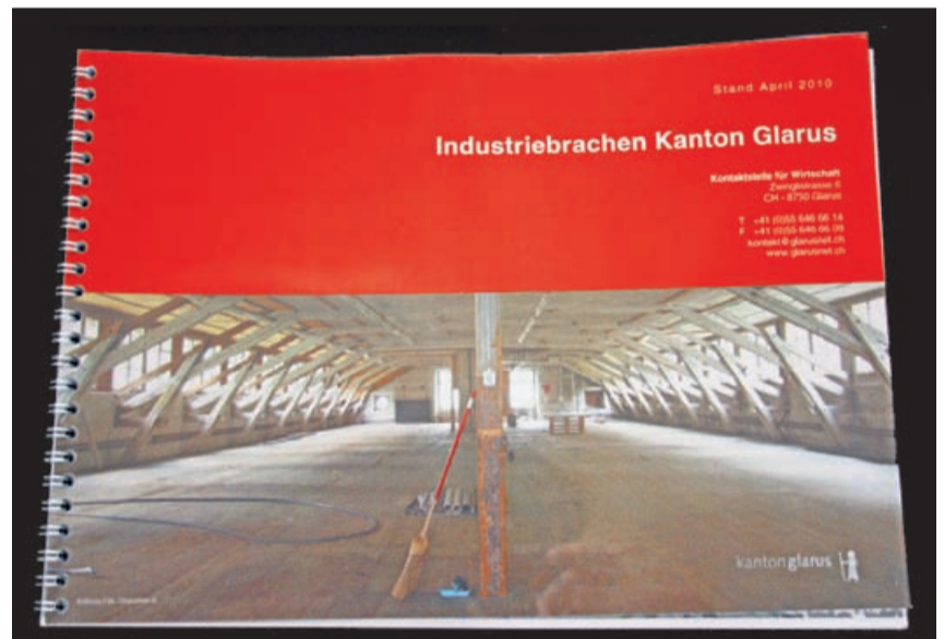
Bietet einen interessanten Überblick über brachliegende Flächen im Kanton Glarus: das neue Industriebrachen-Verzeichnis.

Er ist seit 20 Jahren mit der Umnutzung grosser Industriebrachen unter teilweise äusserst komplexen Bedingungen beschäftigt und brachte erwartungsgemäss einen reichen Erfahrungsschatz mit. Ebenso beeindruckend erläuterte Caspar Jenny, Projektentwickler Jenny-Areal Ziegelbrücke, wie aus der «Neuen Spinnerei» auf dem Jenny-Areal Wohnungen und Büroräume entstanden. Wie Industriebrachen aus der Sicht des Bundesamts für Umwelt (BAFU) am Besten genutzt werden können,